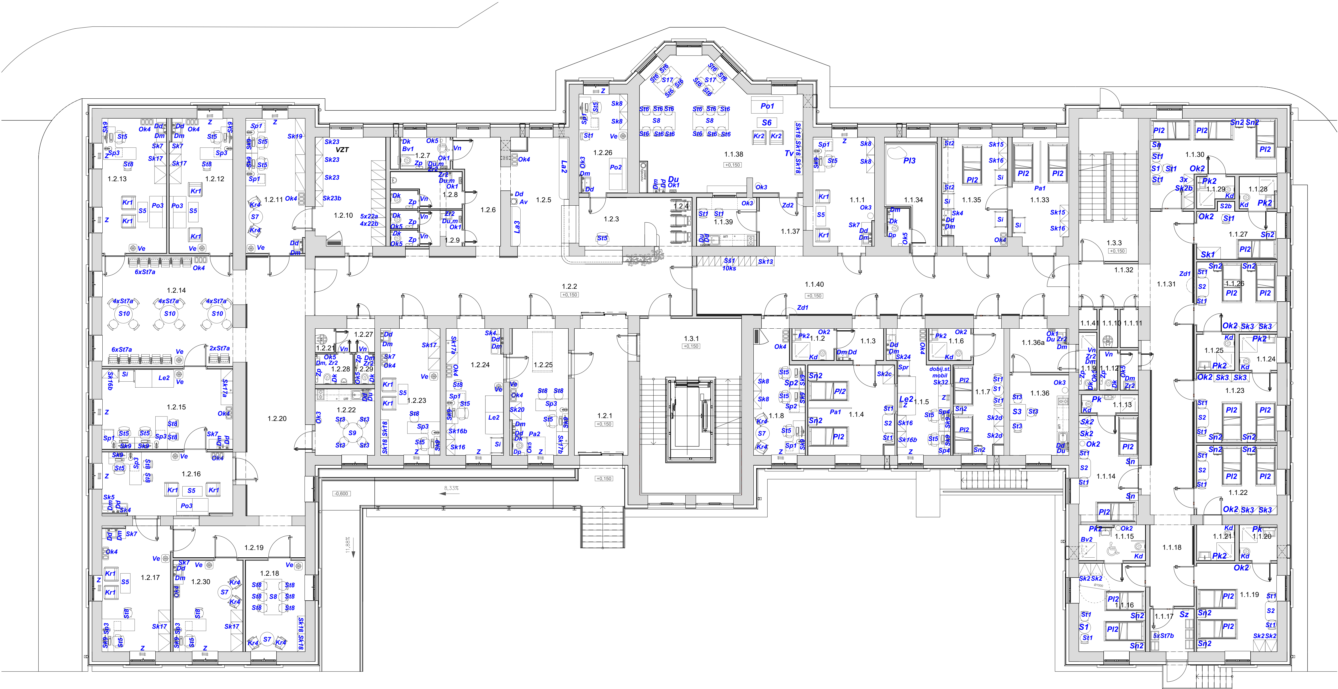
Legenda miestností 1.NP